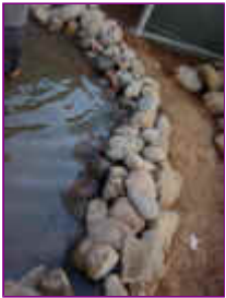
Ref: Fácil-2- 15

14- Desta forma a água de chuva não entrará no seu espelho de água.