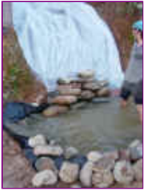
Ref: Fácil-2- 19

19- Após ter feito a cava deite o plástico cobrindo toda a área onde você colocará as pedras. Recorte sobras excessivas e monte assim a sua cachoeira. Observe que as pedras mais achatadas servirão melhor para estrutura da cascata.