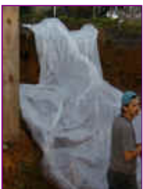
Ref: Fácil-2- 17

16- Se no seu jardim tiver um barranco, ou uma elevação de terra, poderá construir uma cachoeira facilmente, caso não tenha use a terra que saiu do buraco para criar esta elevação.