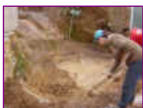
Ref: Fácil-2- 02

01 - Cave um buraco em forma de concha, mantenha o fundo com aproximadamente 50cm de profundidade. Retire torrões e pedras, deixe o fundo liso, não precisa socar ou firmar a terra, basta cavar.