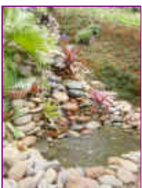
Ref: Fácil-2- 23

22- O riozinho ou corredeira também será feito com plástico ou lona de pvc, note que a bordadura também foi feita e que no fundo você colocará pedras miúdas para evitar que a água passe por baixo de pedras grande e a água não apareça.