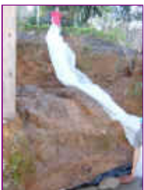
Ref: Fácil-2- 16

15- Veja como fica arrematado a bordadura do seu laguinho, por dentro pedras, por fora plantas e grama.