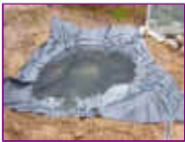
Ref: Fácil-2- 07

06 - Limpe por dentro, retirando torrões e a terra que provavelmente tenha entrado. Prepare a superfície de forma a entrarmos agora no acabamento.