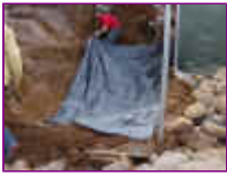
Ref: Fácil-2- 04

para laguinhos, faça com que as bordas sejam alcançadas pela manta esticando-a. Lembre-se de verificar se não há torrões ou pedras na cava antes de colocar a manta.