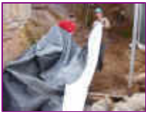
Ref: Fácil-2- 03

para laguinhos, faça com que as bordas sejam alcançadas pela manta esticando-a. Lembre-se de verificar se não há torrões ou pedras na cava antes de colocar a manta.