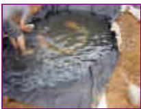
Ref: Fácil-2- 09

08- Levante a borda da manta com água e coloque umas pedras, de forma que a manta fique para cima. Veja que as pedras por trás forcem a manta contra a água.