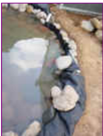
Ref: Fácil-2- 11

10- As pedras de dentro farão o apoio para as pedras da borda. Apenas apoié as pedras buscando uma forma de apoiá-las umas sobre as outras.