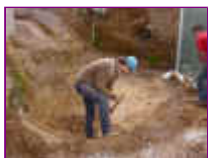
Ref: Fácil-2- 01

01 - Cave um buraco em forma de concha, mantenha o fundo com aproximadamente 50cm de profundidade. Retire torrões e pedras, deixe o fundo liso, não precisa socar ou firmar a terra, basta cavar.