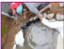
Ref: Fácil-2- 10

09- Você agora vai fazer um trabalho de pedras dentro e fora ao mesmo tempo. Comece a colocar as pedras no fundo, forrando e cobrindo toda a manta.