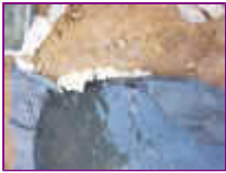
Ref: Fácil-2- 08

07- Agora você vai encher com água, até que fique próximo da borda, não encha muito pois quando colocarmos as pedras um pouco de água vai vazar para fora.