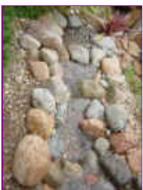
Ref: Fácil-2- 22

21- Com uma mangueira ou tubo de pvc, poderemos levar a água até o ponto mais alto. Para cada caso faremos uma indicação mais apropriada.