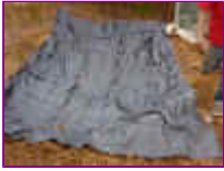
Ref: Fácil-2- 05

04 - Aproxime as pedras da sua cava já com a manta, se suas pedras estiverem sujas de terra ou areia de obra ou de rio, lave-as com água antes de colocar na sua fonte.