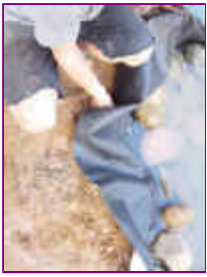
Ref: Fácil-2- 12