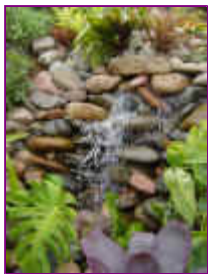
Ref: Fácil-2- 24