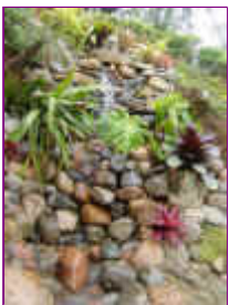
Ref: Fácil-2- 20

19- Após ter feito a cava deite o plástico cobrindo toda a área onde você colocará as pedras. Recorte sobras excessivas e monte assim a sua cachoeira. Observe que as pedras mais achatadas servirão melhor para estrutura da cascata.