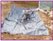
Ref: Fácil-2- 06

05 - Estique a manta, mas é natural que ela fique um pouco enrugada, apenas puxe de cada lado para que evite as dobraduras desnecessárias.