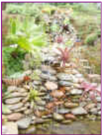
Ref: Fácil-2- 21

20- Para cada caso projetamos um equipamento pré-montado, dependendo das medidas e condições de uso. Este equipamento já será fornecido montado e basta submergir na água.