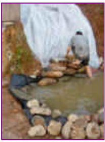
Ref: Fácil-2- 18