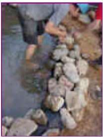
Ref: Fácil-2- 14

13- As pedras que vem de dentro d'água virarão por cima deste envelopamento ou das pedras de fora, formando assim uma bordadura de pedras mais alta que o seu nível de jardim.