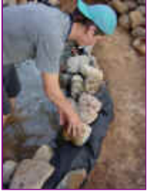
Ref: Fácil-2- 13

13- As pedras que vem de dentro d'água virarão por cima deste envelopamento ou das pedras de fora, formando assim uma bordadura de pedras mais alta que o seu nível de jardim.