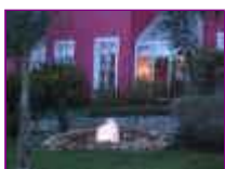
Ref: Fácil-1 -13

14- Nossa! Já começou escurecer! Não tem importância, nosso chafariz é luminoso, com 5 cores opcionais, verde, azul, vermelho, amarelo e transparente (branco). Vamos acender as luzes?