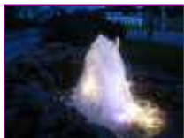
Ref:F ácil-1 -15

Muito fácil, cavamos, colocamos a manta, as pedras, os equipamentos prontos no centro, enchemos com água e pronto! Está funcionando!