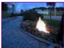
Ref: Fácil-1 -16

Fontes e Chafarizes , Laguinhos de Peixes e Tartarugas, SPA para banho de Pássaros, bebedouros, fontes com potes, e muito mais, agora tudo em um único dia!